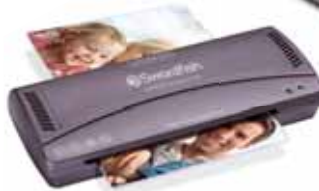
Compact Series A4, A3